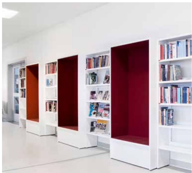
Hyggelige læsehuler rundt omkring på biblioteket Kun fantasien sætter grænser! Vælg læsehuler i størrelser og farver der passer til resten af biblioteksindretningen.