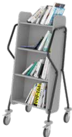
Crossrunner Maxi Brugervenlig og ergonomisk bogvogn med håndtag som giver godt greb for brugere i alle højder.