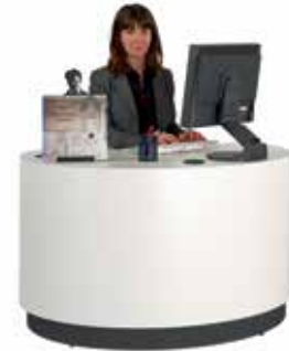
Hjælp eleverne Skranke har kabelgennemføring i bordpladen og kan forsynes med holder til CPU eller laptop.