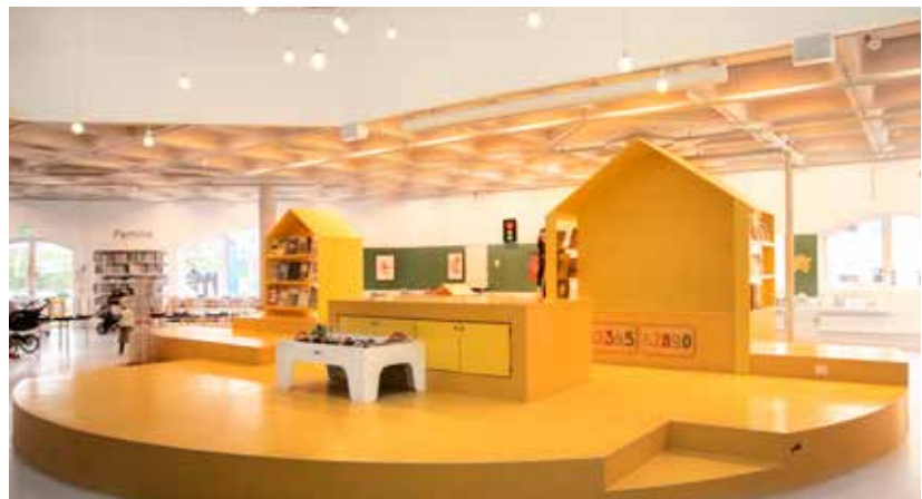
Specialdesignet lege- og udstillingspodie Gør bøgerne til en del af legen med indbyggede siddepladser, læsehuse og legearealer.