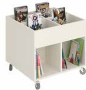
Sara krybbe, midi Funktional og moderne krybbe, der passer ind i alle områder.