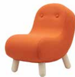
Hæng ud med BOB! Indbyd til læsning med denne lille og karikaturlignende stol til de mindste børn.