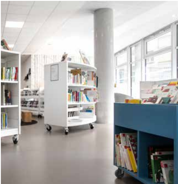
60/30 rund reol og Box billedbogskrybbe - begge med hjul Mobile enheder som kan flyttes efter behov.

Forandring fryder. Flytbare møbler er praktiske og skaber muligheder for variation. De flytbare møbler er ideelle, hvis der ikke er meget gulvplads på selve biblioteket, og når det er nødvendigt at omrokere - for eksempel ved samling af en større gruppe elever.