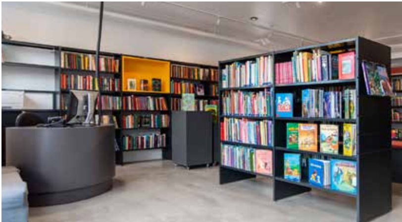
Info Pod skranke i justerbar højde Smart og kompakt skranke i stilrent og funktionelt design.

Kom tæt på eleverne. Det er vigtigt, at de ansatte har et åbent, indbydende miljø og er nemme at komme i kontakt med. Der skal være plads til vejledning og sparring - og indretning med fokus på funktionelle og ergonomiske møbler.