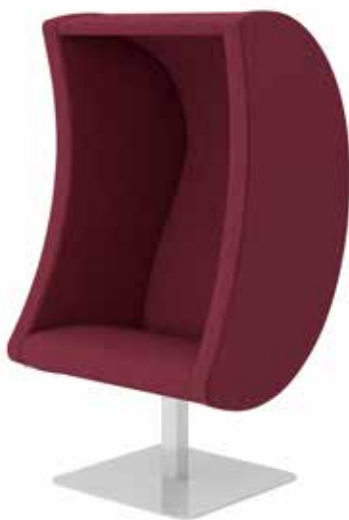
Luna lyd Stol - til aktiv lytning eller afslapning Lyt til en lydbog eller musik - lyden bliver indenfor og forstyrrer ikke andre brugere i biblioteket.