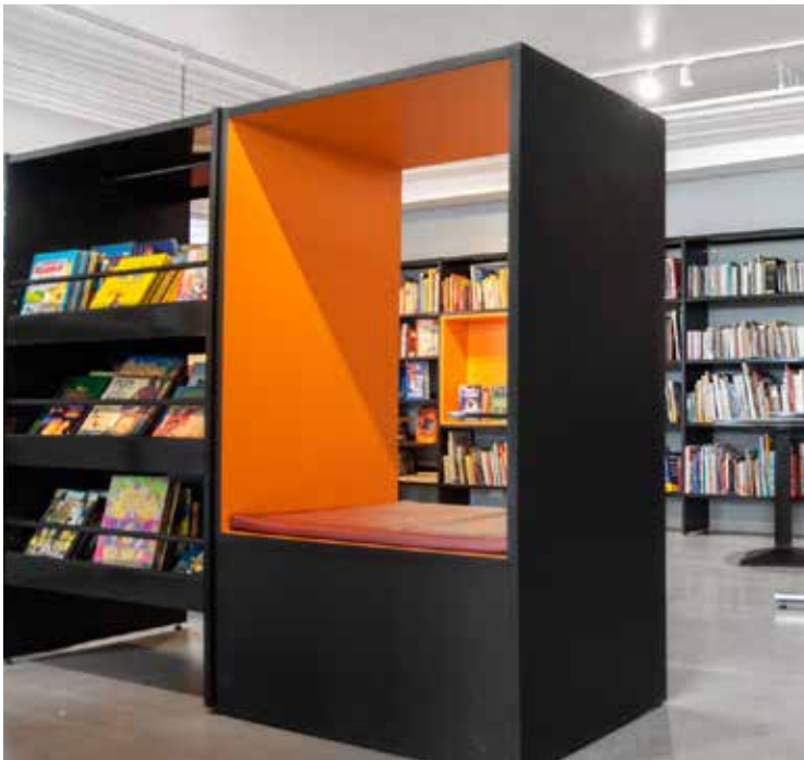
Frontline reel - nu erstattet af Lingo - med indbygget siddeplads Omdan en almindelig reel til en læsehule.

Luk alt andet ude! Eleverne kan have brug for at trække sig tilbage i deres eget rum enten for at læse, studere, lytte eller være kreative. Skab et pusterum i en travl skoledag med plads til fordybelse.