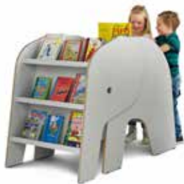
Billedbogssafari med Elof Den søde og charmerende Elof kan bruges som opbevaringskrybbe og til udstilling.