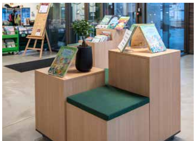
Maria udstillingspodie og krybbe i mange farver Podierne fås i mange farver og varianter.

Flexibel udstilling af bøger med flytbare hylder.