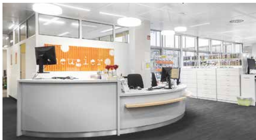
Indbydende og lettilgængeligt kontaktpunkt med Inform skranken Inform kan anvendes fritstående eller som en kombination af forskellige moduler.