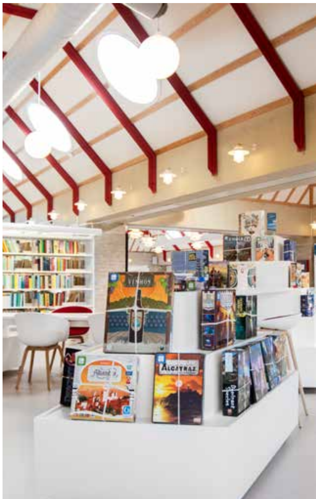
Specialdesignede udstillingspodier til brætspil Tænk ud af boksen - spil liv på biblioteket.

Mobil karrusel med stor kapacitet og hylder, der kan rotere separat.