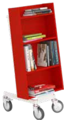
Halland bogvogn Praktisk, enkelt-sided og stabil bogvogn med 4 hylder.

Gør udlån til en leg. Når først eleverne er blevet fristet af de mange spændende materialer, er det tid til at låne dem med hjem. Hold overblikket og gør det nemt at transportere bøger til og fra hylderne med en bogvogn.