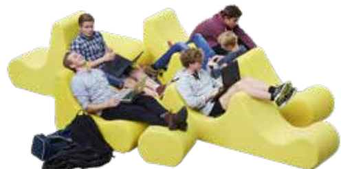
Skab dit eget landskab med Welle Lavt lounge- og pufmøbel bestående af forskellige elementer.