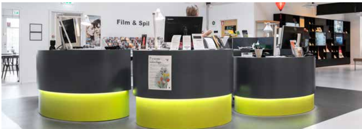
Flotte farver og LED-lys Bring farver og lys i spil. Info Pods kommer i mange forskellige varianter og findes med LED-belysning i "skørtet" foran.