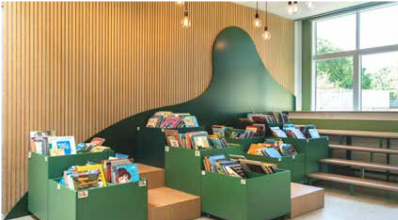
Kundetilpassede grønne Maria krybber med masser af rum til opbevaring Maria krybber fås i forskellige størrelser og kan rumme mange materialer.

Skab læselyst med legende omgivelser . Både store og små børn bliver stimuleret til at læse mere, når indretningen er varierende og legende. Brug krybber og podier til at få bøgerne til at skille sig ud og anvend dem som lege- eller sidde møbler.