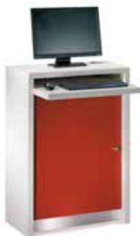
Søg spørgsmål og find svar Inform er en fleksibel og diskret søgestation, der kan placeres hvor som helst på biblioteket.