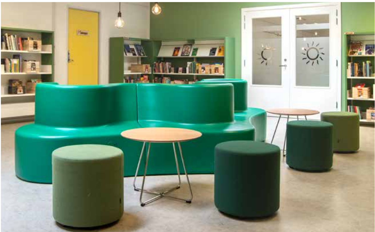
Cloverleaf modulær sofa og Drum puf En samling af fleksible og flytbare møbler, der kan give rum til privatliv eller åbne op for snak og samvær.