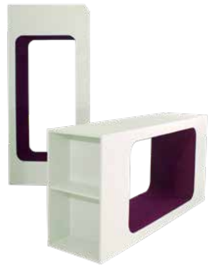
Cocoon - skab zoner og siddeområder Modulerne kan kombineres på mange forskellige måder til at lave hyggelige huler og "rum i rummet".